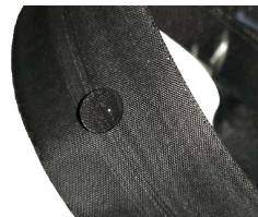
TM1F 布紋注膠防水拉鏈