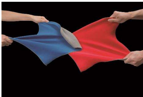
非膠自黏布擁有細緻的手感以及強力粘性