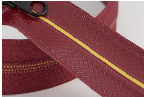
T 雙色注膠防水拉鏈