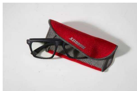
非膠自黏布已廣泛使用在日常生活等各種領域