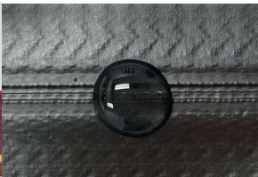
T1 全單色注膠防水拉鏈